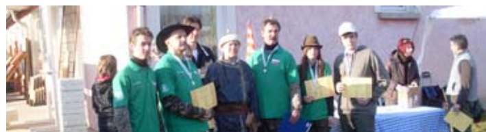
A FELVÉTELEN A BÁSTYA ÍJÁSZ KLUB TAGJAI A MAŐS KÉPVISELŐVEL A VERSENY KIÉRTÉKELÉSÉT KÖVETŐEN