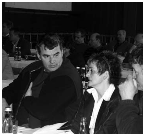
A VÁROSI KÉPVISELŐ-TESTÜLET MELLETT MŰKÖDŐ VÁLLALKOZÁSI, ÜZLETI, SZOLGÁLTATÁSI ÉS IDEGENFORGALMI BIZOTTSÁG TAGJAI IS RÉSZT VETEK A TALÁLKOZÓN, MELYET TÖBB VÁROSI KÉPVISELŐ IS MEGTISZTELT JELENLÉTÉVEL