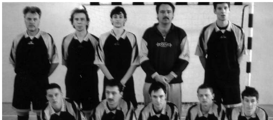
Felvételünkön Balogfala csapata