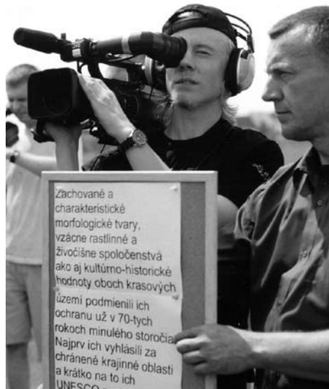
A Cornix Artifex filmműhely stábja a Karsztmélységek őrzői című film forgatása közben a Szlovák-karsztban