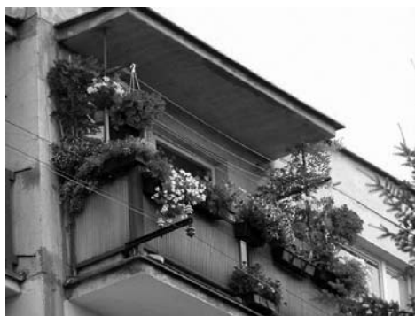
2. hely Bugán család, Jánošík utca