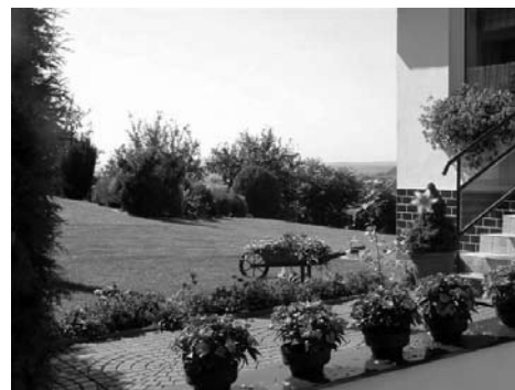
3. hely Mikla család, Vasutas utca