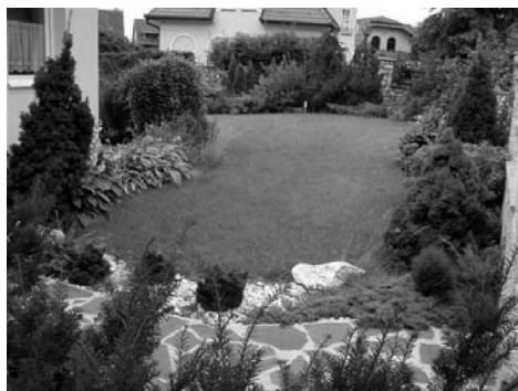
2. hely Longai család, Tormás