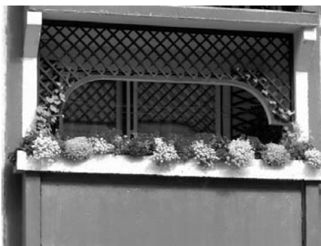
1. hely Adler család, Novomeský utca