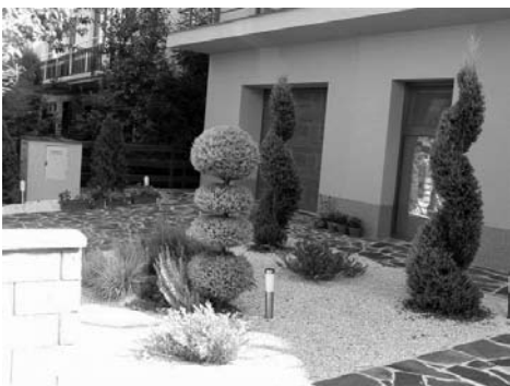
1. hely Kéry család, Szeles utca