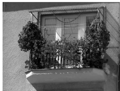
3. hely Bital család, Szövetkezeti utca