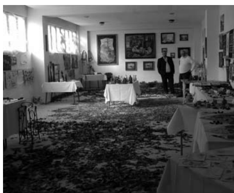
Leplezvé az omladozó falakat ős ruhába öltözött az alkalmi kiállítóterem.