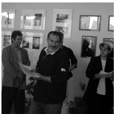
A kiállítóknak emléklappal köszönték meg, hogy elhozták Rimaszécsbe műveiket.