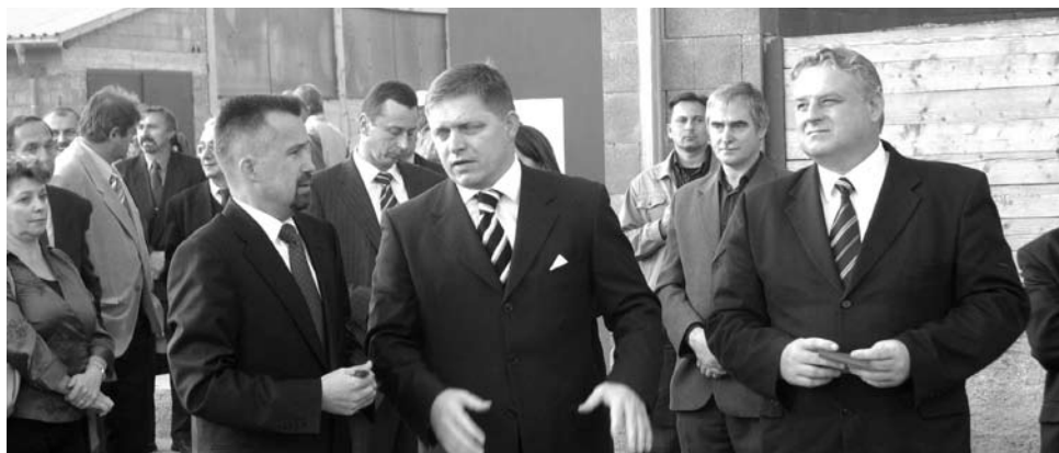
Robert Ficot városunkba is meginvitálták. Talál majd ránk időt?