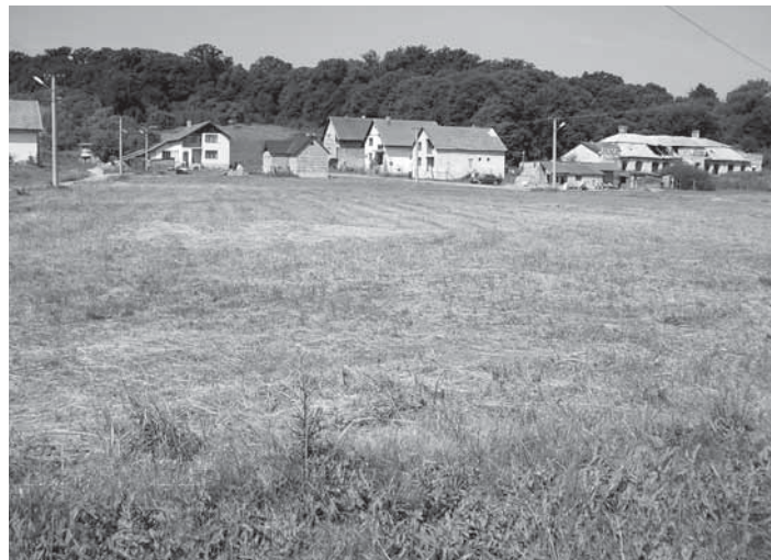
Egy év múlva itt áll majd a két háztömb

kampányában is ígéretet tett két újabb háztömb átadására, amelyeknek munkálatai 2007. július 4-én kezdődtek meg. Így újabb 16 roma család (ami kb. 80 főt jelent) kap majd új otthont. Az anyagi fedezet eloszlása szintén 80-20 % arányban a már fentebb említett módon valósul meg. A két lakótömb építkezési munkálatainak kivitelezésére több magáncég is pályázott, amire végül is a jogot a Meding Építkezési Vállalat nyerte el. A cég munkásai, ill. a leendő lakók közül néhányan már elkezdték a munkát, és az időjárástól függően 2008 nyárára lakhatóvá teszik a ma még csak üres telket. Egy- ill. kétszobás lakások lesznek majd a lakótömbökben, higiéniai helységgel, valamint konyhával és központi fűtéssel. A háztömbök helyét a