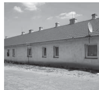
A már átadott lakótömb

van – az egyik szoba pár hónapja beomlott, s csak a véletlennek köszönhető, hogy közben senki nem sérült meg. S véleményem szerint, az is a csodával határos, hogy az a ház még egyáltalán áll. Azóta nincs központi vizük – a szomszédhoz járnak vízért, valamint a tető is több helyen beázik. Elmondták, hogy nagyon örülnek annak, hogy új helyre költözhetnek, és hogy lehetőséget kaptak arra, hogy gyerekeiket egészségesebb környezetben neveljék fel.