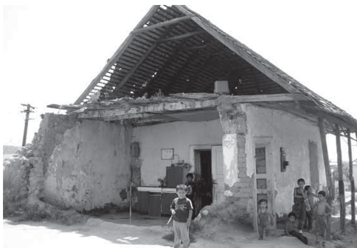
„Az egyik szoba majdnem ránk omlott!”

letett meg tehát a polgármesteri hivatal azon pályázata, amellyel 2002-ben sikerült megszerezni az Építkezési és Regionális Fejlesztési Minisztériumtól a lakások felépítéséhez szükséges pénz 80 %-át. A maradék 20 % technikai kivitelezését a község állta, ill. a leendő lakóknak is részt kellett vállalniuk a munkálatokból. 12 roma család részére – akik korábban a helyi, ma már romnak számító, kastélyban éltek – 2005. december 23-án került átadásra két háztömb.