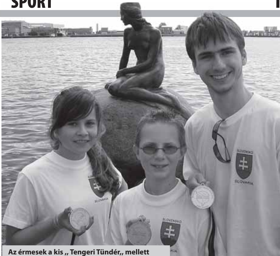
Az érmesek a kis „Tengeri Tündér,” mellett