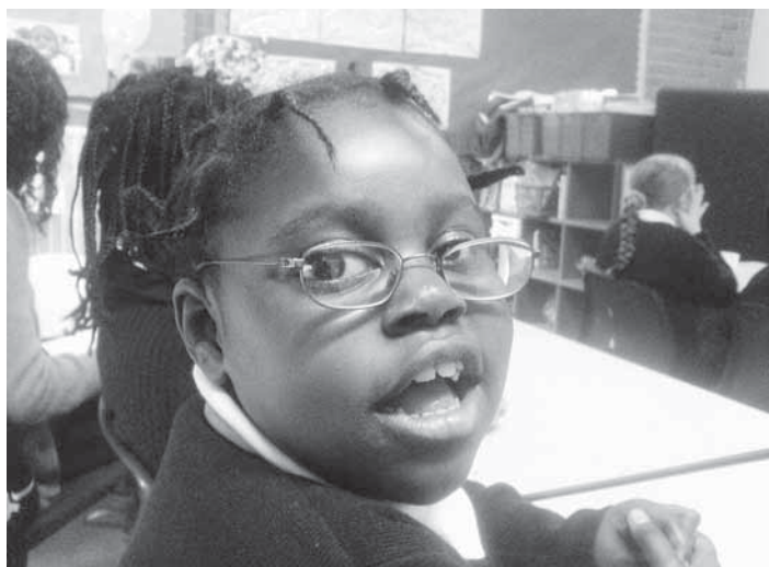
A fotó munka közben - London egyik speciális iskolájában, autista gyerekekről készült

A hosszú évek utáni visszatérésem szülőföldemre kellemetlenebb pillanatokot hozott számomra, mint amire számítottam. Munkát ke-