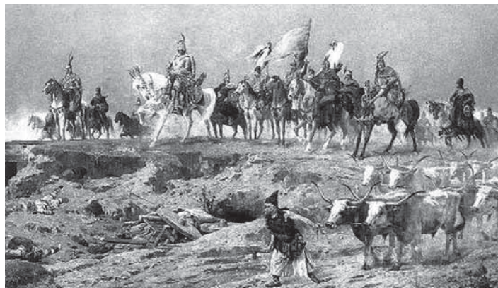
Árpád és vezérei: „A magyarok bejövetelére” a Feszty Körkép legjellemzőbb jelenete

*Négy hete, ahogy utazik már a magyar sereg. A Don folyam messze elmaradt tőlök, messze a kedves bércek, a bájos ligetek. Oroszthon határai közt vannak, távolról egy sötét pont