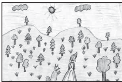
Czene Réka 4.B